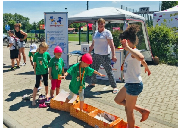
Foto: Frau Feldmann beobachtet gespannt die Aktionen der Kinder am Barfußpfad.

Öffentlichkeitsarbeit: Im Rahmen des Kinderturnfestes „Turnkids erkunden die Welt“, das von unserem Mitgliedsverband Rhein Hessischer Turnerbund mit veranstaltet wurde, konnte unser Verein am 1. Juni weit über 100 Besucher an unserem Infostand und bei unseren Mitmachangeboten begrüßen. Hierbei konnte man sich über das Konzept der „Bewegungskita RLP“ informieren und seine Wahrnehmung an einem selbstgebauten Outdoor-Barfußpfad schärfen sowie einen Pedalo-Rollbrettparcours ausprobieren.